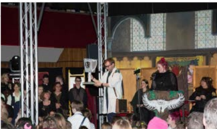
Foto: Übergabe des neuen Hauspokals durch den Hauslehrer