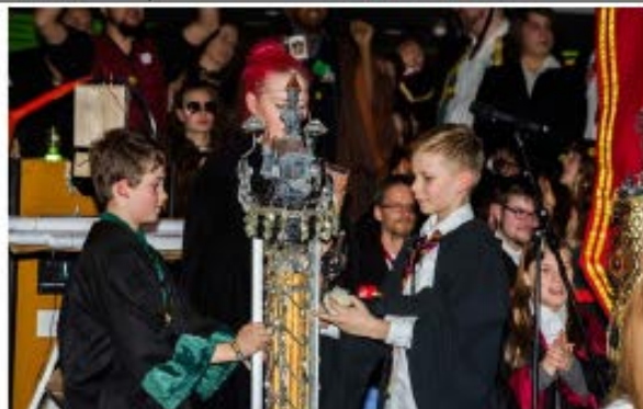
Foto: feierliche Übergabe des Jahrespokals an Griffindor durch den Vorjahressieger Slytherin