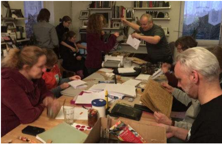
Hufflepuffs bei kreativer Arbeit

Dass das Haus Hufflepuff große Kreativität an den Tag legt, ist allgemein bekannt. So trafen sich an einem arbeits- und lernfreien Wochenende wieder einmal viele Hufflepuffschülerinnen und -schüler mit ihren Hufflepuff-Lehrkräften, um diese einmal richtig auszuleben. Da wurden Bücher gebastelt, die eine ganze Bibliothek füllen könnten, da wurden Lieder geschmettert, die es garantiert in diesem Schuljahr in den Gängen zu hören geben wird, da wurden Leibgerichte kreiert – deren köstlicher Duft waberte noch am nächsten Tag durch die Räume. Die Schüler des Zauberschlosses können sich von den Künsten der Hufflepuffs inspirieren lassen und daran Teil haben – im Hufflepuff-Gemeinschaftsraum, im Unterricht der Hufflepuff-Lehrkräfte, im Hufflepuff-Quidditch-Team auf den Gängen und im ganzen Zauberschloss! Sprecht einfach die schwarz-gelben Leute an – sie helfen Euch in jedem Fall weiter! TaTi