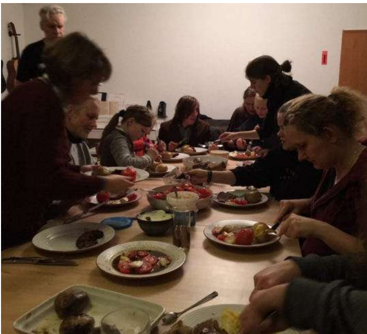
Hufflepuffs beim Verspeisen ihrer kulinarischen Kreativitäten

Dass das Haus Hufflepuff große Kreativität an den Tag legt, ist allgemein bekannt. So trafen sich an einem arbeits- und lernfreien Wochenende wieder einmal viele Hufflepuffschülerinnen und -schüler mit ihren Hufflepuff-Lehrkräften, um diese einmal richtig auszuleben. Da wurden Bücher gebastelt, die eine ganze Bibliothek füllen könnten, da wurden Lieder geschmettert, die es garantiert in diesem Schuljahr in den Gängen zu hören geben wird, da wurden Leibgerichte kreiert – deren köstlicher Duft waberte noch am nächsten Tag durch die Räume. Die Schüler des Zauberschlosses können sich von den Künsten der Hufflepuffs inspirieren lassen und daran Teil haben – im Hufflepuff-Gemeinschaftsraum, im Unterricht der Hufflepuff-Lehrkräfte, im Hufflepuff-Quidditch-Team auf den Gängen und im ganzen Zauberschloss! Sprecht einfach die schwarz-gelben Leute an – sie helfen Euch in jedem Fall weiter! TaTi