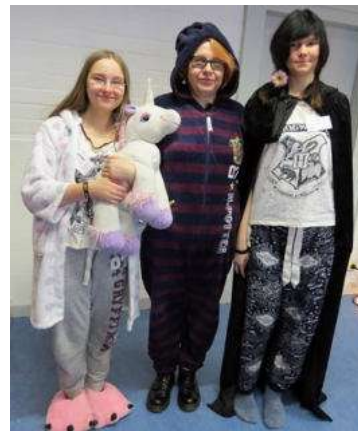
Teil des Redaktions-Teams