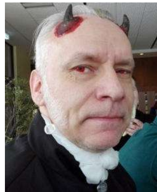
Flammbus: „Können diese Augen lügen?!“