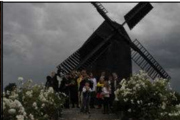
Kein Transportmittel für Zauberer, sondern eine „Windmühle“ mit Hufflepuffs davor

lediglich um ein von den Muggeln „Windmühle“ genanntes Gebäude handelt, welches zum Mahlen von Getreide zu Mehl genutzt wird. Dies funktioniert jedoch nur bei starkem Wind und entsprechender Ausrichtung der Flügel. Leider war es windstill – und in der Muggelwelt sind offensichtliche Windzauber ja leider verboten, sodass das Gebäude leider nicht in seiner Funktion betrachtet werden konnte. Mitglieder des Forscherclubs bleiben aber dran und werden berichten.