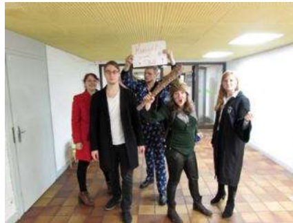
Bild 4: Erfolgreich hat sich das kleine Grüppchen vergrößert. Erfolg 2 für Team Leech!