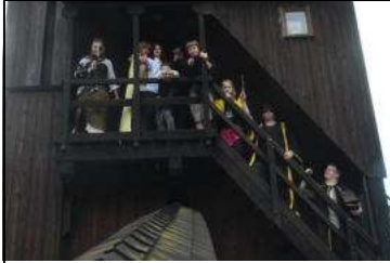
Gedränge auf dem Weg zum Eingang

Es ging das Gerücht, dass an einer Kreuzung in Berlin ein getarntes Transportmittel für Zauberer steht – deutlich erkennbar an vier