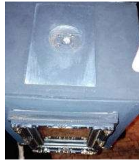
Artefakt ohne Aktivator

Prof. Tramalemo war im Rahmen ihrer Tätigkeit für den Forscherclub gestern mit drei Schülern im Hause unterwegs. Sie versuchten herauszufinden, wie ein neues magisches Artefakt eingesetzt werden kann. An diesem Artefakt fehlte offensichtlich ein Teil, um dieses zu aktivieren. Sie haben herausgefunden, dass das Artefakt Emotionen messen und vermutlich auch steuern kann. Sie wollten das Artefakt heute an die Maschine von Prof. Polymeter, die den Wert des Zauberschlosses messen soll, anschließen, um die notwendigen Daten zu vervollständigen. Schließlich steigern Emotionen ebenfalls den Wert unseres Zuhauses.