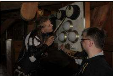
Höhen- und Geschwindigkeitsmesser?

rechtwinklig ausgerichteten Flügeln und einer Tür im Gehäuse. Dem wollten einige Hufflepuffs genauer auf dem Grund gehen. Das „Geflüg“ wurde intensiv von innen und außen in Augenschein genommen. Trotz des Vorhandenseins einiger Sitzgelegenheiten im Inneren, Anzeigeinstrumenten und womöglich verschiedenartigen Antriebsstoffen stellte sich jedoch heraus, dass es sich