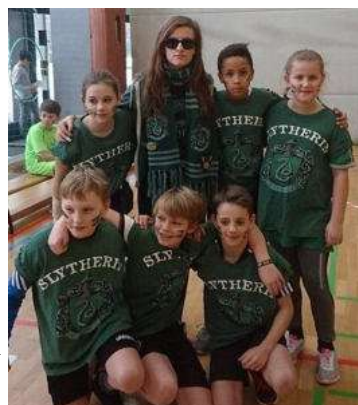
Slytherin Team klein