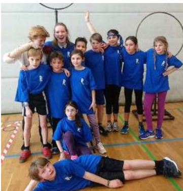
Ravenclaw Team klein