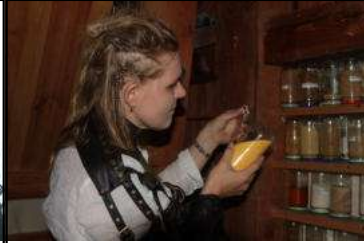
Antriebsstoffe? Nein – nur verschiedene Getreidesorten

rechtwinklig ausgerichteten Flügeln und einer Tür im Gehäuse. Dem wollten einige Hufflepuffs genauer auf dem Grund gehen. Das „Geflüg“ wurde intensiv von innen und außen in Augenschein genommen. Trotz des Vorhandenseins einiger Sitzgelegenheiten im Inneren, Anzeigeinstrumenten und womöglich verschiedenartigen Antriebsstoffen stellte sich jedoch heraus, dass es sich