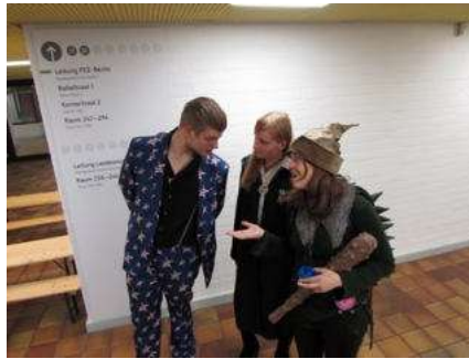
Bild 2: Heute ziehen sie einen professionellen Berater hinzu, um mehr Leute für ihre Sache zu gewinnen.