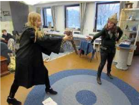
Bild 4: ...scheinbar so gut, dass sie sogar selber über die Folgen überrascht wurde.