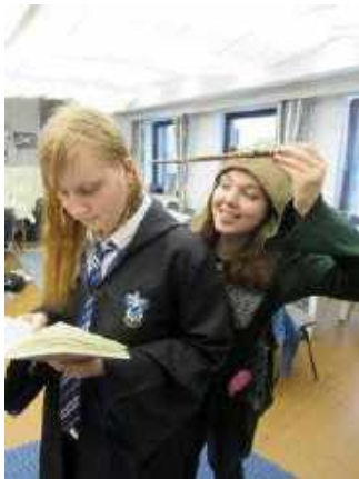
Bild 1: Unsere frustrierte Prof. Leech ist am Grübeln wie sie ihre Sportart doch noch unter die Leute bringen könnte.