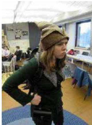
Bild 2: Nicht nur in Überlebenskunst geschult, sondern auch die Anwendung vielfältiger Zaubersprüche gemeistert, benutzt sie listig einen Verwirrungszauber.