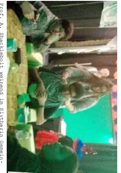
Prof. A. Shacklebolt weinend im Slytherin Gemeinschaftsraum... wurde mit Liebeszauber belegt, hat nun Liebeskummer. Slys haben ihn aufgenommen und getröstet. Er fühlt sich sichtlich wohl dort

Ob das Augen von unendlich Augen schauen up fast fähig zu sein das Ergebnis einer tollen Fortschrittsmatrix (Krawattenfrage) Der Krawatten (Glaubensfrage)