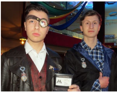
Foto: links - A.P. Crowley, rechts Oswald Saruman, sein Assistent

Eine Schülerin, die eigenmächtig das Labyrinth betreten hatte, verunglückte dort und verlor das Bewusstsein. Prof. Black, die Sicherheitsbeauftragte des Zauberschlosses, war nicht in der Lage ihr zu helfen. Zum Glück war der kompetente Zaubertrankmeister, Mr. A.P. Crowley, zugegen und rettete die Schülerin mit einem seiner Tränke.