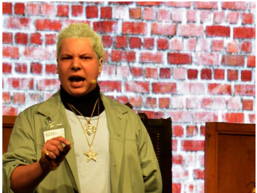
Fieser Blick – schmeichelnde Worte. Was ist Dr. Xanders wahres Ich? Selbst unsere magische Linse konnte kein klares Bild von ihm machen.

Der Tagesprophet bezweifelt ausdrücklich die wissenschaftlichen