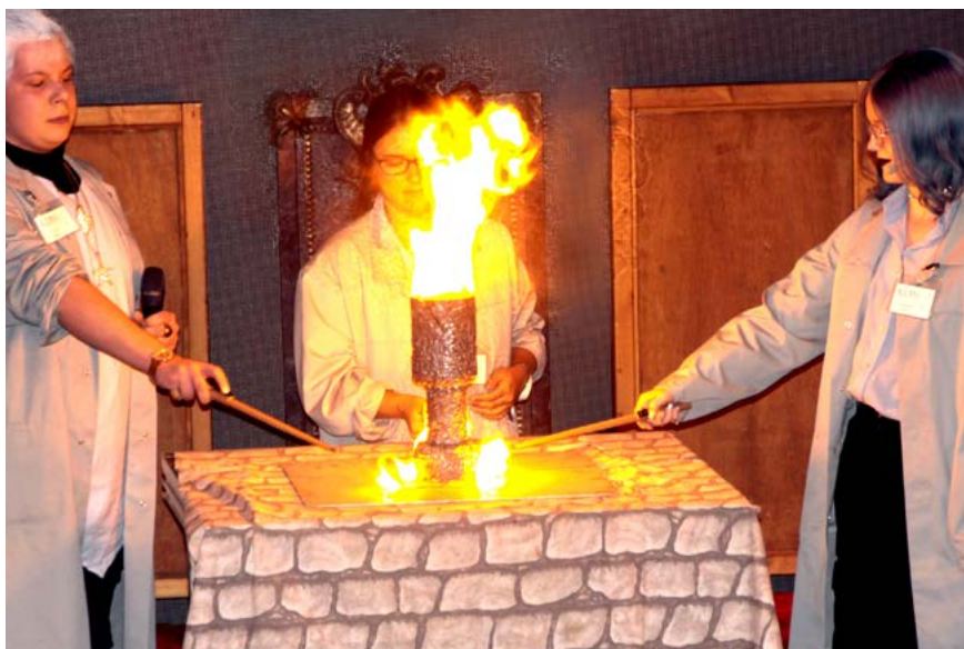
Delegierte entzünden den Feuerkelch

Aber das war noch gar nicht der Höhepunkt. Nein, es wurde noch pompös eins drauf gesetzt, denn zum ersten Mal seit dem Trimagischen Turnier wurde der Feuerkelch zum Einsatz gebracht! Prof. Tonks-Lupin war angesichts dieses magischen Artefakts voller Euphorie, die Aufregung war ihr noch von der letzten