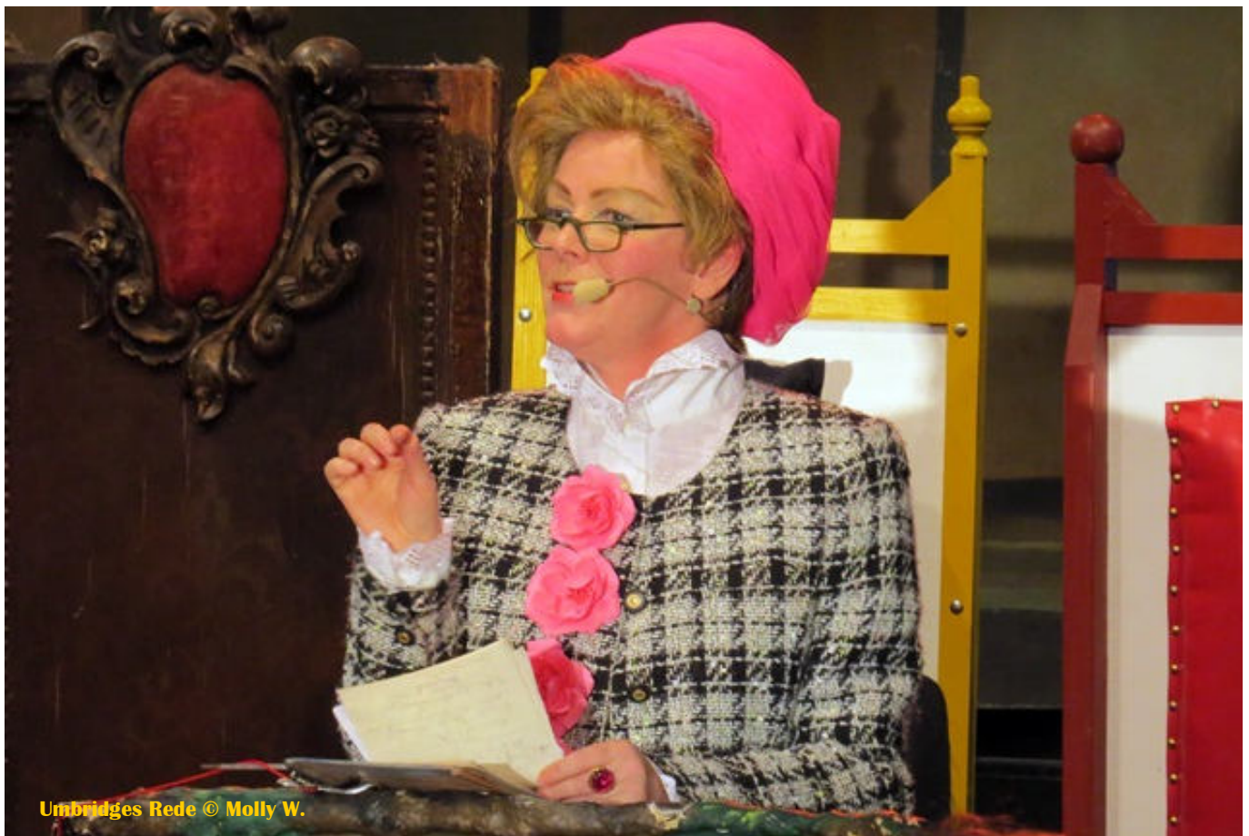
Umbridges Rede

Wahlkampfrede am frühen Morgen? Den Eindruck hätte man gewinnen... Weiter S. 2