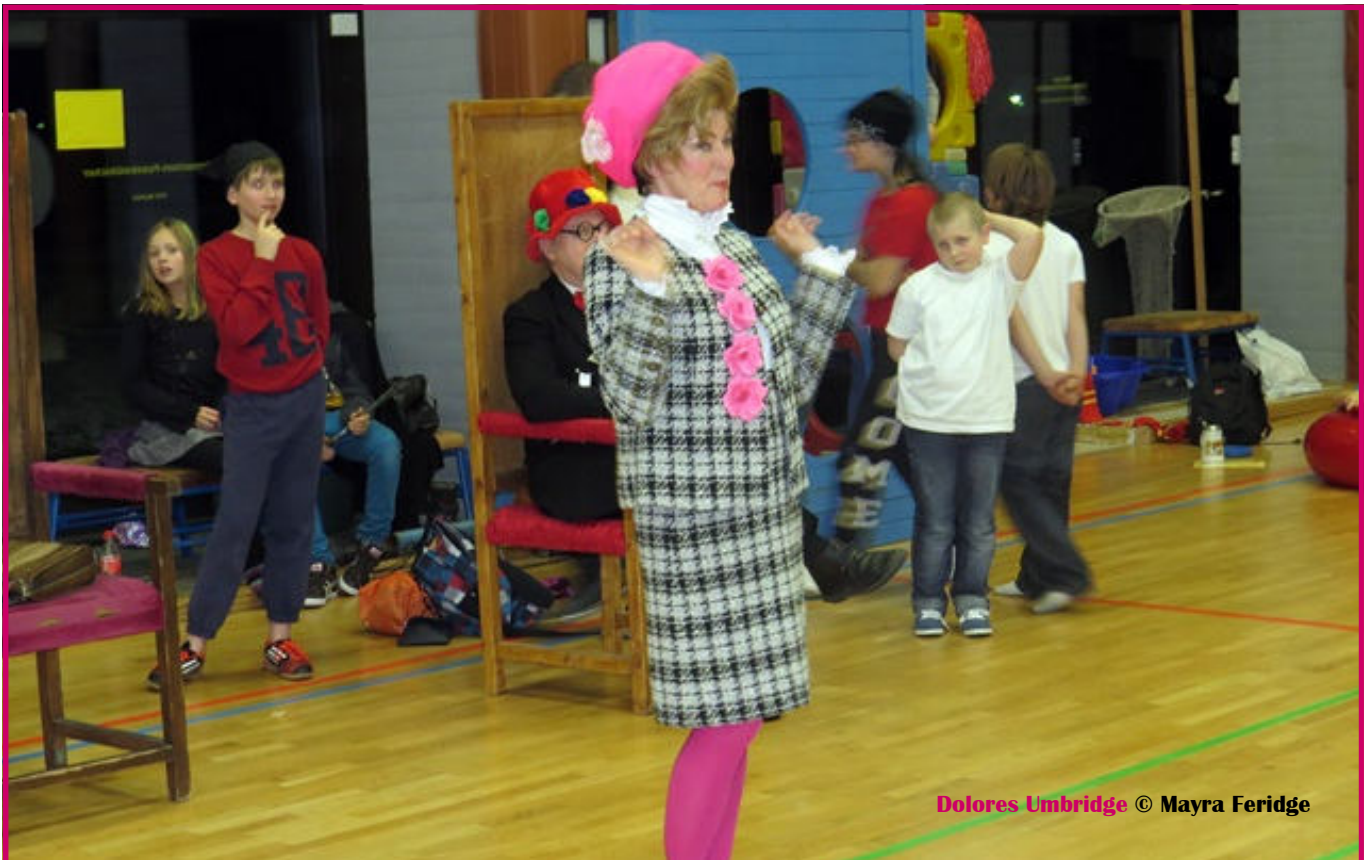
Dolores Umbridge © Mayra Feridge

...und ich wurde nicht ordnungsgemäß begrüßt. Aber das wird sich ab Morgen ändern. Das ist nur ein vorübergehender Zustand. Zitat Dolores Umbridge! weiter auf S. 2