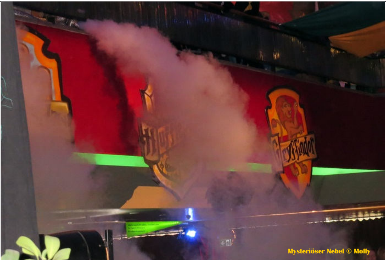
Mysteriöser Nebel

Bis gestern über Wochen versteinert - und nun verschwunden... Das Schicksal meint es derzeit nicht besonders gut mit Holly Rosewood , der ... Fortsetzung S. 2