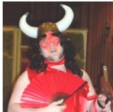
Der Helm der Walküre...

Während dieses rauschenden Festes traten auch die allseits bekannten und beliebten Schicksalsschwestern auf. Sie begeisterten ihre Fans mit einem Song, bei dem sie von etlichen Backgroundtänzerinnen flankiert waren.