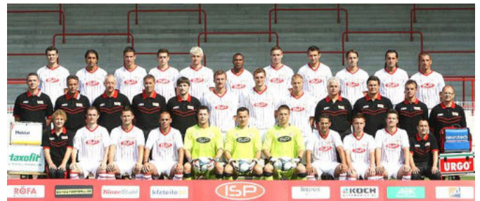
Die Siegermannschaft: 1. FC Union