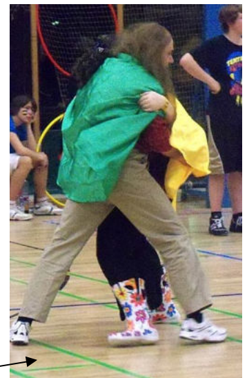
Mr. Filch im direkten Zweikampf mit Nanny Ogg