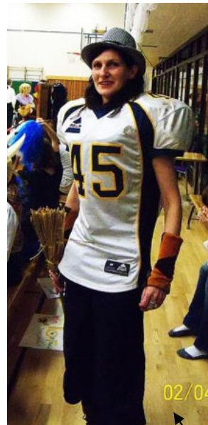
Miss Filch im stylischen Outfit

Aber nicht nur die Ravenclaws haben falsch gespielt - uns kam zu Ohren, dass die Slytherins in ihrem letzten Spiel zu Acht auf dem Feld waren bis zwei Minuten vor Spielende. Der Schiedsrichter schickte den 8. Mann vom Platze, ließ das Spiel jedoch weiterlaufen. Haben wir nicht feste Regeln, an die sich jeder Spieler und auch die Schiedsrichter zu halten haben? Kann die Meisterschaft nun überhaupt noch anerkannt werden?