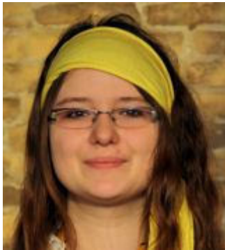
Für Hufflepuff: Haely O'Conner