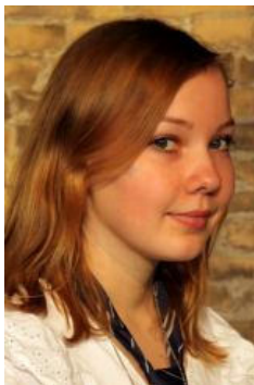
Für Ravenclaw: Kathy Lovegood