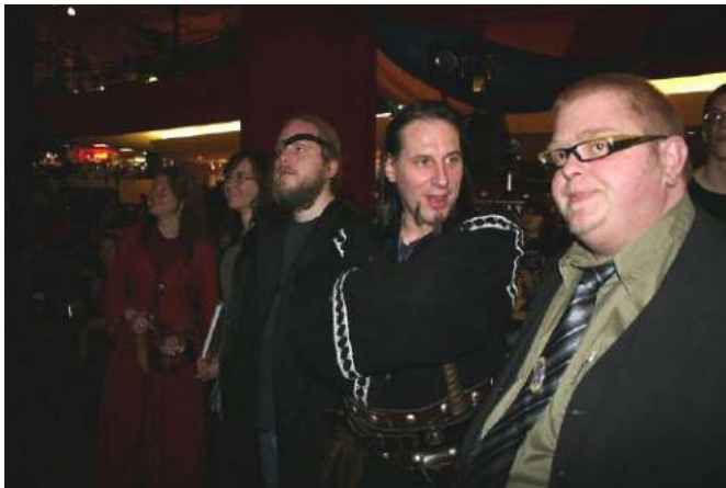
Lehrer kommen und gehen... und einige bleiben :)