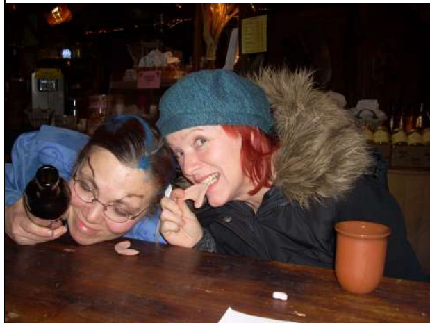
Kannibalen im Schloss füllen Lehrer im Eberkopf ab