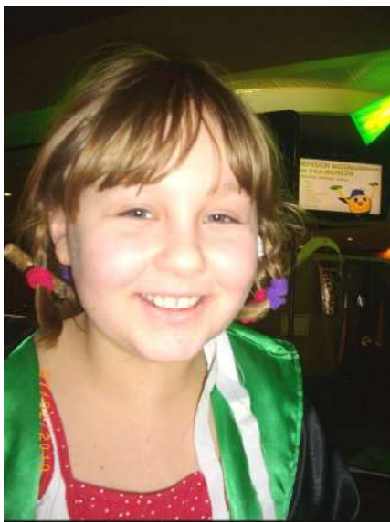
Links im Bild: Schreiberin Lilly Lotti Weasley, Tochter von Molly Weasley, Kleines Volk...