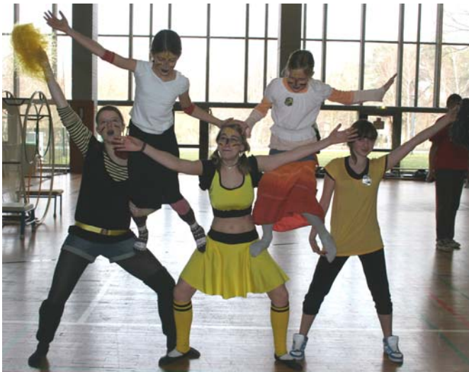
Ein Teil des Dreamteam von Hufflepuff