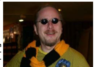
(Nicht zur offiziellen Vermarktung freigegeben, nur in Absprache mit dem Autor!)

Venatorius Broomflash 'The Flying Badger'