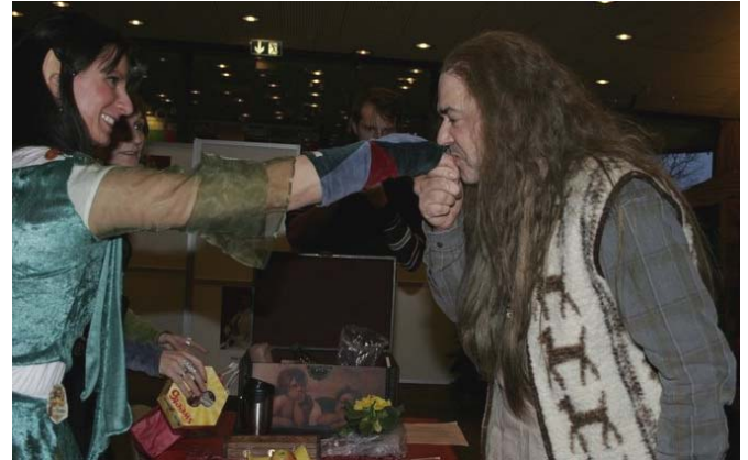
Artikel Seite 8 - Klatsch & Tratsch