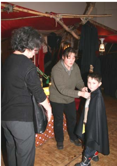
GEWAND- NÄHEREI -

zauberhafte Mäntel, Kleider und vieles mehr