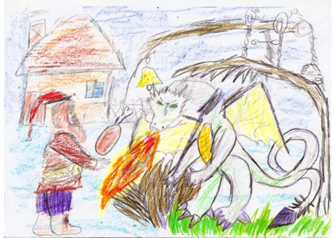
für Rubeus Hagrid (nr. 1 Hornschwanzdrache) von Magister Max

ben! Beste Limbo - Limbo Grüsse aus Griechenland - Magister Florentine