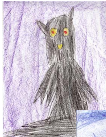
für Minerva McGonnagal (Nr. 2 Training mit ihr unterm Regenbogen) von Magister Florentine