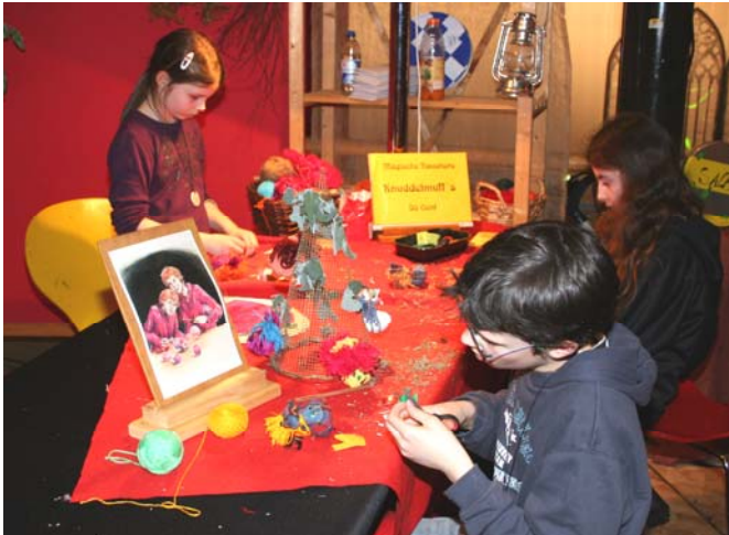
WINKELGASSE - Zauberhüte und -stäbe u. v. m.