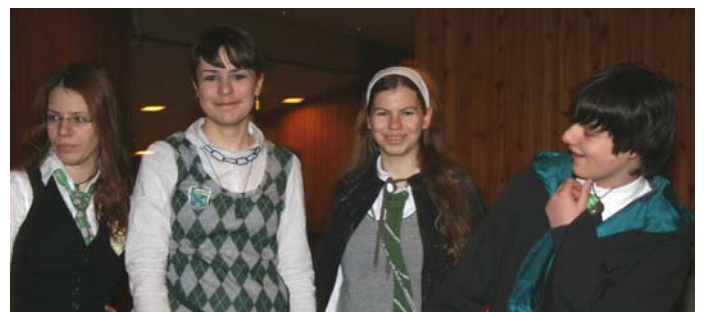
Rechts im Bild - gerade beim Baggern ↗

Er verachtet Schlammblüter und zuviel weiße Magie. Außerdem ist er schadenfroh, arrogant, selbstbewusst und ein ganz übler Macho. Mädels nehmt euch in Acht! Er baggert jedes weibliche Wesen an.