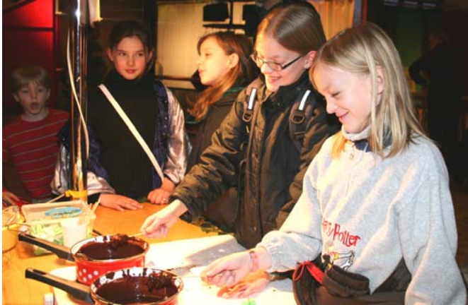
DIE 3 BESEN - Schokofrösche, Butterbier u.v.m.