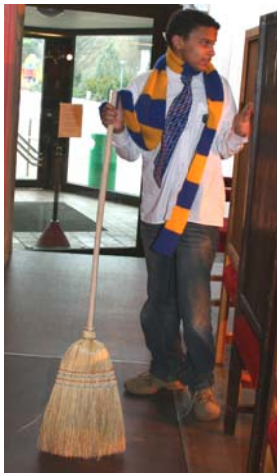
Ryan Evans bei seiner wahren Berufung - Fegen der Großen Halle

Es gibt zwei Grundwahrheiten auf dieser Welt: Schwarzmagier sind klüger als Weißmagier und die Erde ist eine Scheibe.