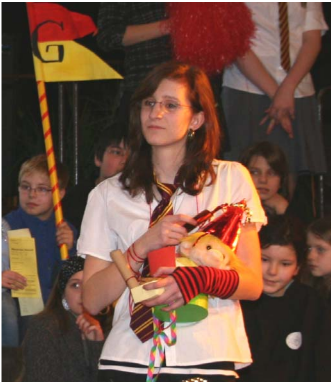
Hier beim Weitflug der Zauberwesen...

Maddy ist 16 Jahre alt und kommt aus Irland. Der Sprechende Hut hat sie für Gryffindor eingeteilt, weil er viel Mut bei ihr spürte, obwohl sie sonst eher eine untypische Gryffindorschülerin ist. Ihr Vater ist Zauberstabbaumsucher, ihre Mutter, ehemalige Aurorin, lebt nicht mehr. Sie hat noch je zwei Brüder und Schwestern. Sie lebte lange im St. Mungo, da sie den Tod der Mutter nicht verkraftet hatte und später einfach keine Lust auf Schule hatte. Im St. Mungo bekam sie Privatunterricht und bekam dort alles, was sie wollte. Sie ist dadurch sehr verwöhnt. Als sie von ihrem älteren Bruder Dean viel von Hogwarts, den Ereignissen und Wettbewerben hörte, wollte sie dies selber miterleben und so entschied sie sich St. Mungo endlich wieder zu verlassen. In Hogwarts hat sie sich ein interessantes Hobby zugelegt. Sie hat ihre Leidenschaft für das Tauchen entdeckt.