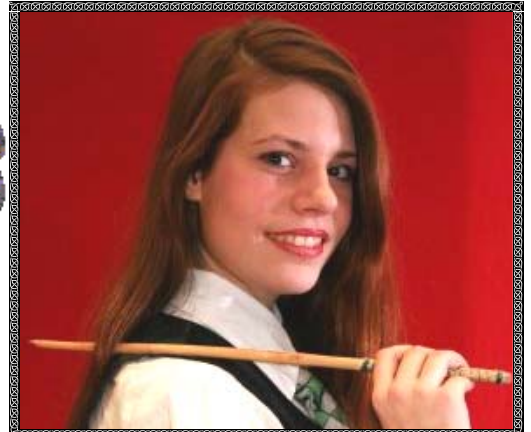
Faralda Superbia Zabini aus Slytherin