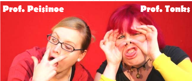
Von Weasley Zauberschertz-Artikel genascht???