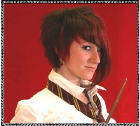
Sinead May J. Black - aus Gryffindor