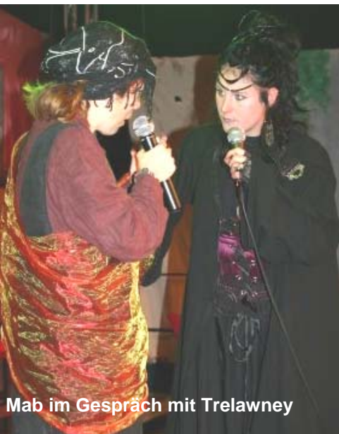
Mab im Gespräch mit Trelawney

Merlin kam als Sohn ein Prinzessin und eines Incubus (= Dämon oder gefallener Engel) zur Welt. Schon als Kind zeigten sich seine übernatürlichen Fähigkeiten, welche ihm das Leben retteten. Er erbt die Tugend seiner Mutter und die magischen Fähigkeiten seines Vater. Die Geschichte beginnt im 5. Jahrhundert mit einem britischen König namens Vortiger, dessen Bemühungen, einen Turm zu bauen immer wieder fehl schlugen. Er befragte seinen magischen Berater, welcher ihm riet