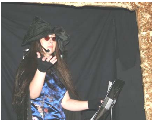
Lebende Bilder aller Wände vereinigt euch!!!

Nachdem hier nun ständig Gesellschaften gegründet werden auf Hogwarts, übernimmt auch unser sprechendes Bild, Rapa McPunzel, diese eigenartige Angewohnheit und gründet eine Gemeinschaft. Ihre Gesellschaft nennt sich: GdLB—Gemeinschaft der lebenden Bilder. Diese Gesellschaft kümmert sich darum, dass die Bilder regelmäßig abgestaubt werden, nicht beschmutzt, zerstört und nicht behangen werden. Rapa setzt sich dafür ein, dass die Bilder Schmerzensgeld bekommen, falls diese Verletzungen, verbal oder körperlich, erleiden, wie z.B. die Fette Dame, als sie von Sirius überrumpelt wurde.