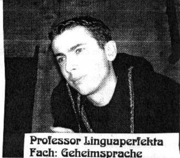
Professor Linguaperfekta Fach: Geheimsprache