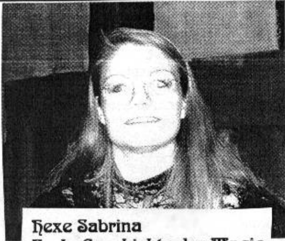
Hexe Sabrina Fach: Geschichte der Magie