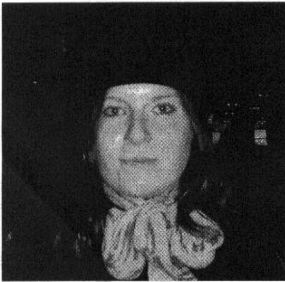
Lucia ci Montré