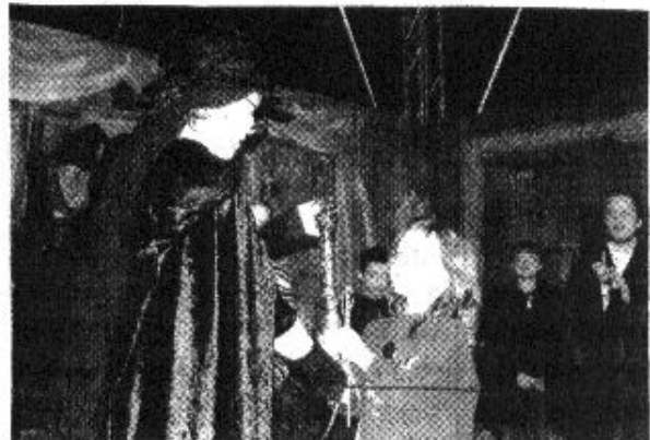
Übergabe des Hauspokals an eine Schülerin Slytherins

→ Leider mußten wieder etliche ZAG's wegen verschiedener Vergehen aberkannt werden, also gebt euch mehr Mühe und achtet auch auf die anderen Schüler, damit solche Strafen nicht mehr stattfinden müssen!