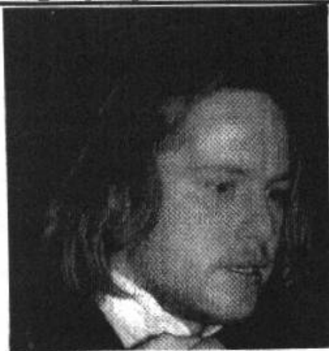
Portrait Prof. Alastor Moody

Er ist 75 Jahre alt, seit einem Verjüngungszauber sieht er aber wie ein 30-jähriger aus.