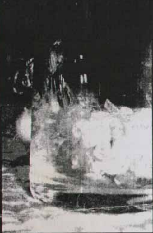
Der Stein des Anstoßes: Das Glas von Slytherin

Bei der gestrigen Verleihung des Hauspokals kam es zu einem sehr umstrittenen Sieg für das Haus Slytherin. Unbestätigten Gerüchten zufolge verschwanden im Verlauf des Nachmittags etliche Punktsteine für Slytherin aus den Unterrichtsräumen und am Ende des Tages ging Slytherin mit großem Vorsprung als Sieger hervor. Leider konnten wir kein Mitglied des Lehrkörpers zu einer Stellungnahme bewegen. Es wird allerdings ausgeschlossen, dass Lucius Malfoy (angesehenes Mitglied der Zaubererschaft), welcher zur pokalverleihung nicht anwesend war, an dieser Sache beteiligt ist. Wir hoffen, dass in Zukunft die Hauswettbewerbe fair und korrekt ablaufen.